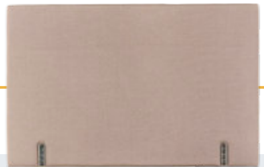
Modèle présenté : Tissu ED10