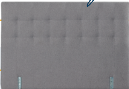
Modèle présenté : Tissu JU06