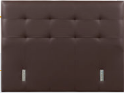
Modèle présenté : Tissu LC12