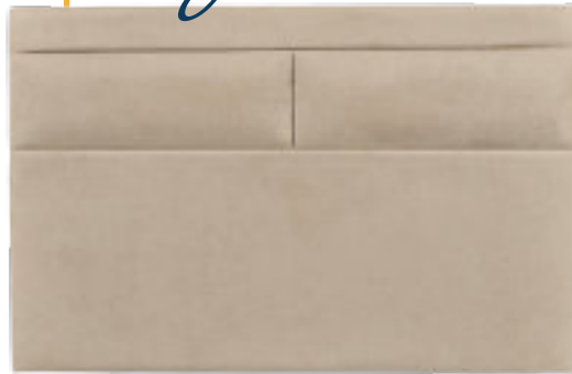
Modèle présenté : Tissu SE01