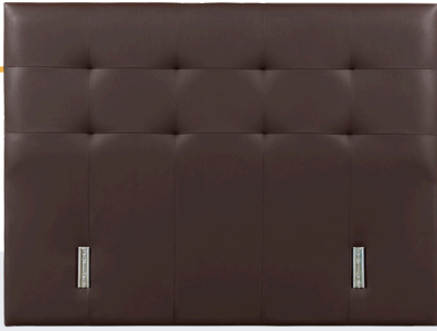
Modèle présenté : tissu LC12