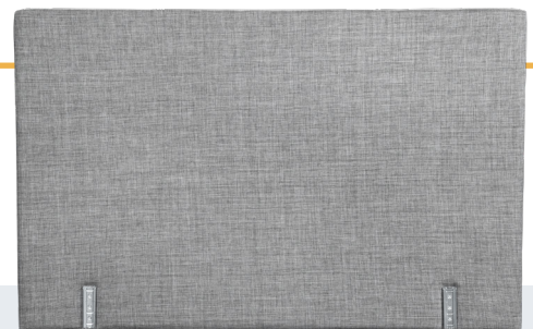
Modèle présenté : tissu ED7