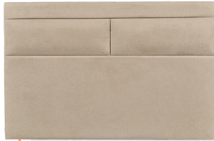
Modèle présenté : tissu SE01